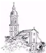
St. Peter und Paul, Freising-Neustift