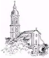
St. Peter und Paul, Freising-Neustift