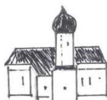
St. Laurentius, Haindlfing