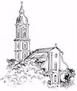
St. Peter und Paul, Freising-Neustift