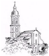
St. Peter und Paul, Freising-Neustift