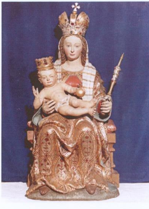
Wallfahrtskirche St. Maria Rudlfing