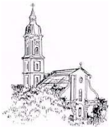
St. Peter und Paul, Freising-Neustift