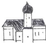
St. Laurentius, Haindlfing